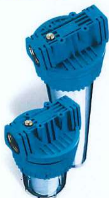
Contenitori per cartucce serie FP3 standard testa inserto ottone vaso san trasparente FP3 filter cartridge housing with brass insert and transparent sump