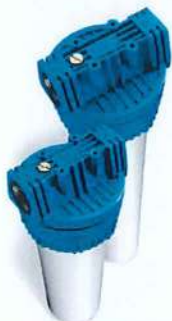
Contenitore per cartucce serie FP3 standard testa inserto ottone vaso opaco bianco FP3 filter cartridge housing with brass insert and opaque white sump

*Alloggia cartucce speciali foro 32mm/Special cartridges housing hole 32mm.